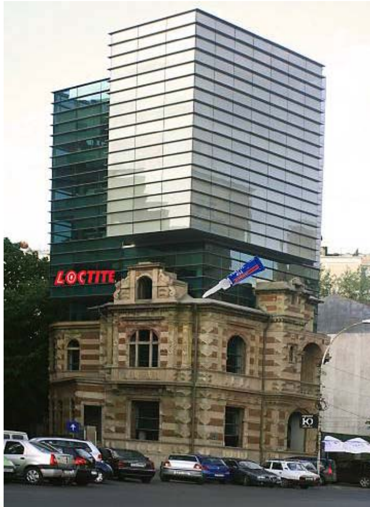
Outdoor - Valentina Bacu (Scoala ADC, 2009)