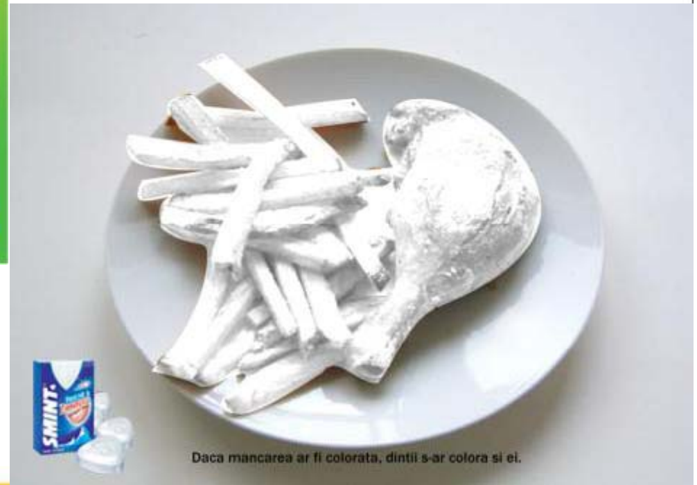
Daca mancarea ar fi colorata, dintii s-ar colora si ei.