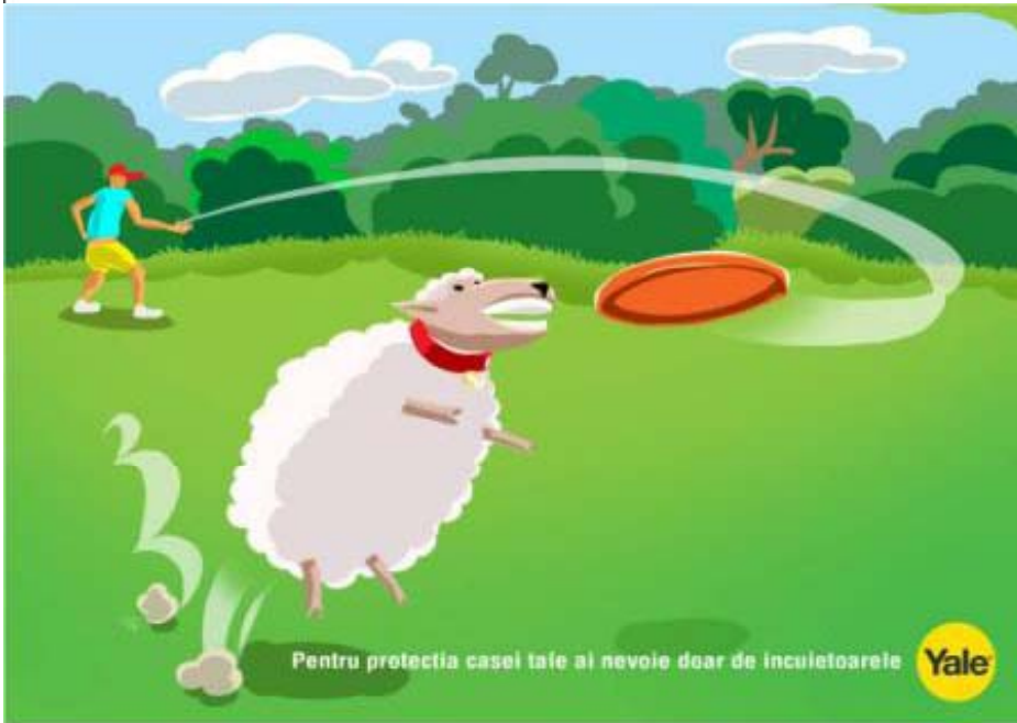
Outdoor – Bogdan Raileanu (Scoala ADC 2008)